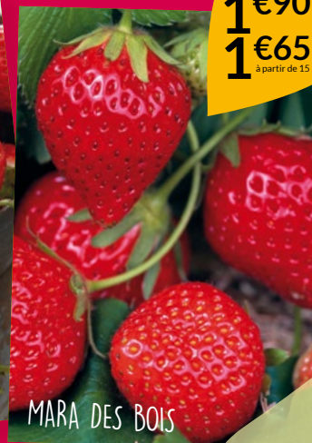
MARA DES BOIS